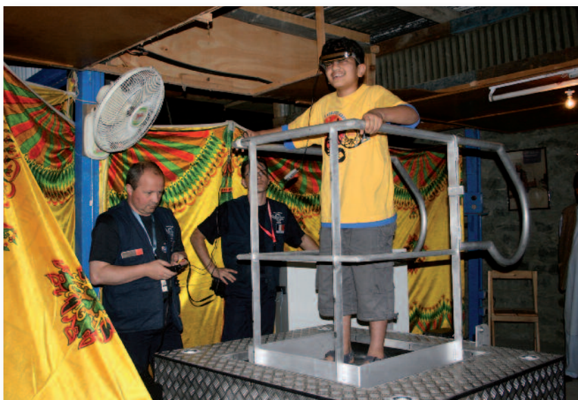
Formation risque sismique effectuée au Pakistan

majeure. Le développement de ces actions (sensibilisation, formation, simulation) permettrait de réduire les conséquences des séismes en acquérant les bons comportements. Il serait également bon d'envisager la création d'un module de « formation et de prévention du risque sismique » qui serait inclus dans les programmes scolaires.