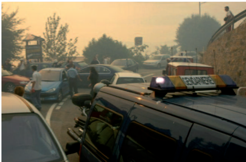
Embouteillage lors d'un incendie forêt.