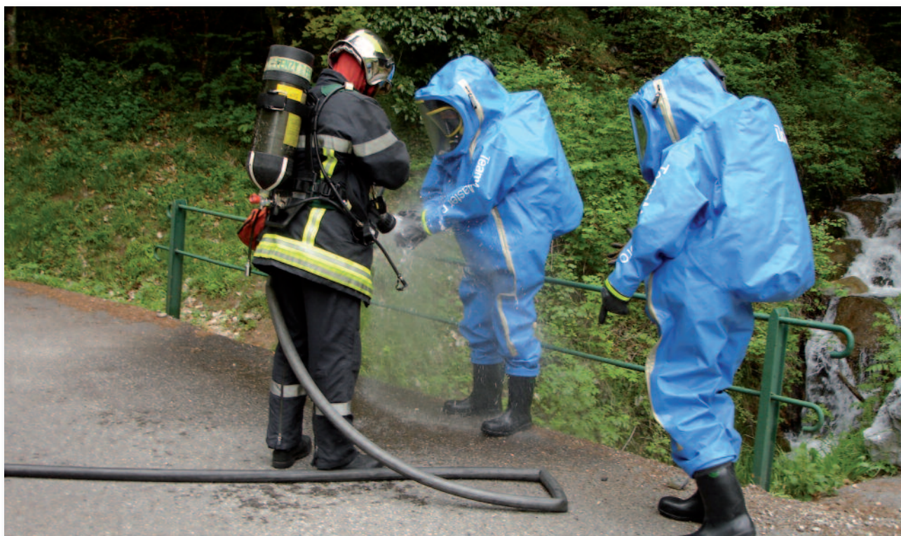
Intervention de la CMIC de Savoie sur une fuite de produits chimique