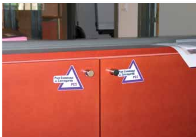
Local de rangement « PCS » mairie de Salaise sur Sanne

En 5 ans, le PCC de la ville de Salaise sur Sanne a largement évolué. Ces évolutions visent à rendre son PCS plus efficient. Les améliorations du PCC ont été rendues possibles uniquement parce que des exercices ont été effectués et des retours d'expériences organisés. Il est plus que probable que ce PCC connaîtra d'autres évolutions dans le futur afin de renforcer les points forts et améliorer les points faibles propres à l'organisation PCS de Salaise sur Sanne.