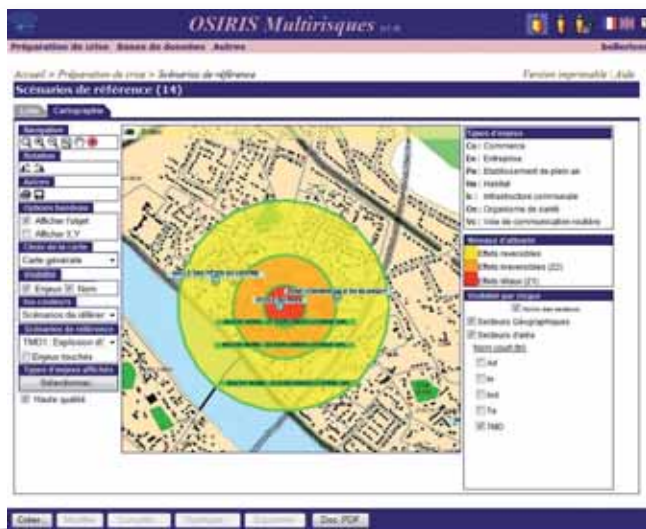
Les fonctions cartographiques d'OSIRIS-Multirisques