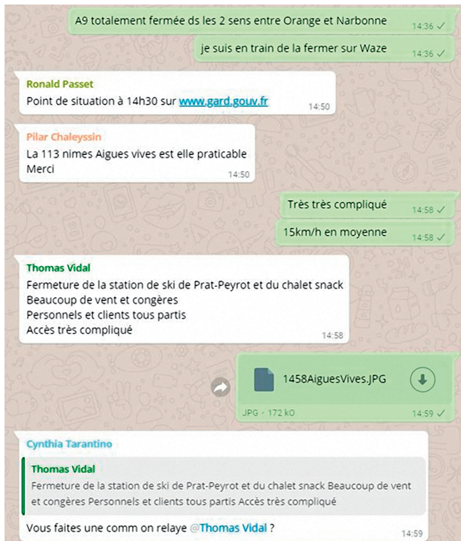
Capture écran WhatsApp 1 : A9 totalement fermée à cause de la neige sur le Gard - février 2018

Suite à cela, ces trois personnes qui ne se connaissaient pas ont décidé de continuer à œuvrer ensemble, en se mobilisant 24 heures sur 24 dans une salle virtuelle via l'application WhatsApp.