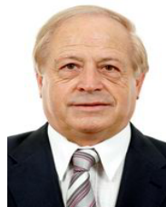
Roland COURTEAU Sénateur de l'Aude

Mardi 23 juin 2009 de 8 heures 30 à 13 heures