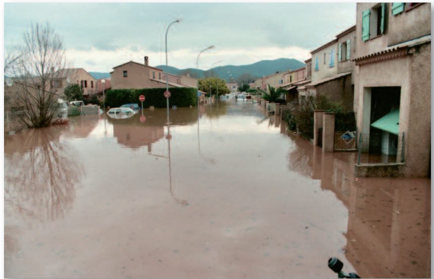
Crue du Gapeau : Quartier de l'Oratoire 19/01/2014

De plus, des phénomènes significatifs de ruissellement urbain satureront fréquemment les capacités du réseau d'évacuation des eaux pluviales.