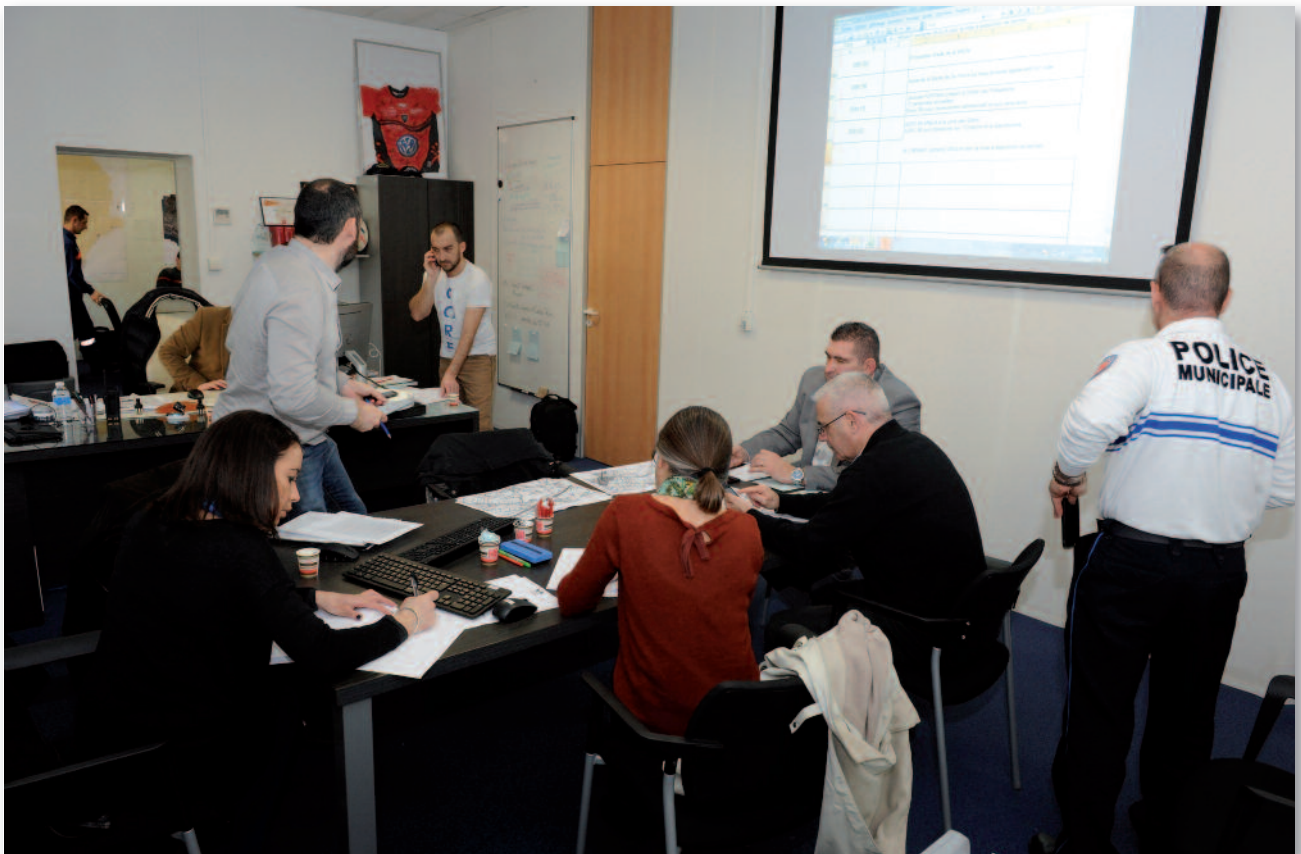
Poste de Commandement Communal sur les inondations de janvier 2014.