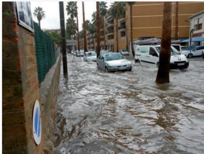
Crue du Gapeau : quartier de la Gare, ruissellement 19/01/2014