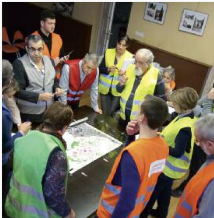
Entraînement sur table Saint Paul en Jarez Décembre 2016

Il est conseillé de compartimenter chaque tableau de bord en zones. Chaque zone correspond à une fonction opérationnelle. Si vous avez eu la sagesse d'organiser votre PCC en cellules, selon l'organisation classique des Postes de Commandement (PC) régaliens, vous aurez comme zones : situation, anticipation, logistique, actions, communication, population, chacune de ces zones comportant plusieurs cases selon vos besoins.