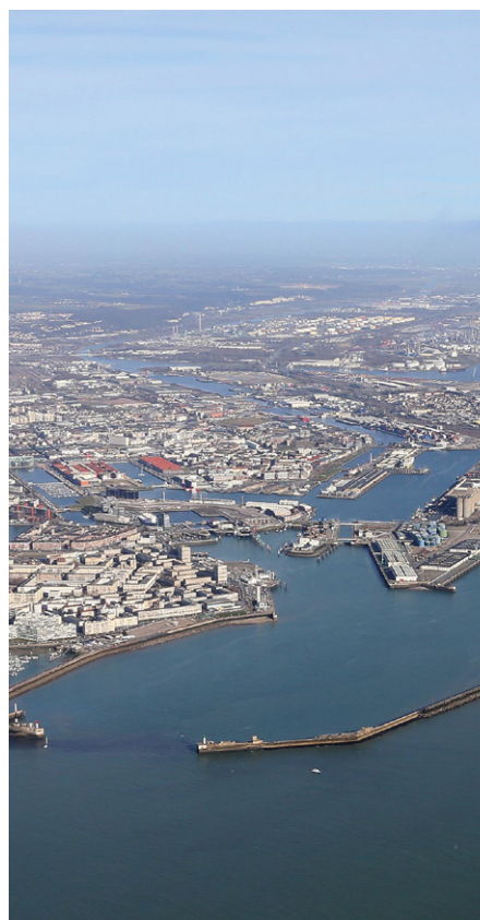
Le Havre et l'entrée du port - © HAROPA PORT

« Au-delà donc, de répondre aux obligations réglementaires, l'intercommunalité a souhaité développer un principe d'intelligence collective, de solidarité et de mutualisation. »