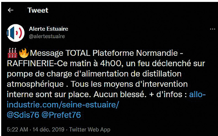
Premier tweet relatant le début d'incendie