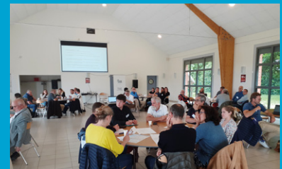
Les équipes municipales préparent leurs propositions de thèmes prioritaires, des rythmes de travail, etc.

Un premier défi à relever : le 8 juin 2022, première réunion du club PCS-PICS, quelle participation ?