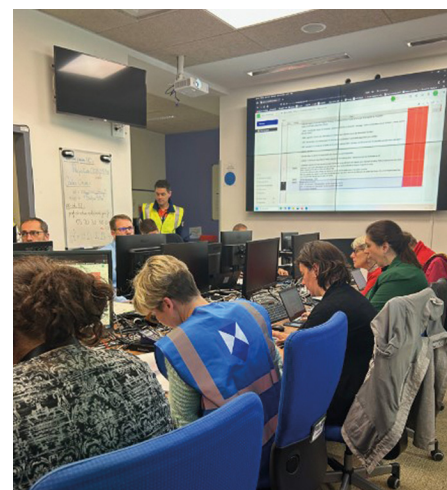
Activation du Centre opérationnel départemental (COD) de la préfecture du Nord lors de l'exercice

Au-delà du document, la démarche engagée contribue à diffuser une culture partagée de la protection du patrimoine culturel, en reconnaissant pleinement sa valeur collective et son importance dans les politiques locales de gestion des risques.