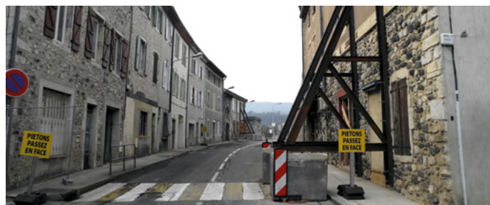
Étaïement d'immeubles à Mélas (travaux engagés le 9 décembre 2019 sur réquisition du préfet pour pouvoir réouvrir la nationale 102 avant Noël)