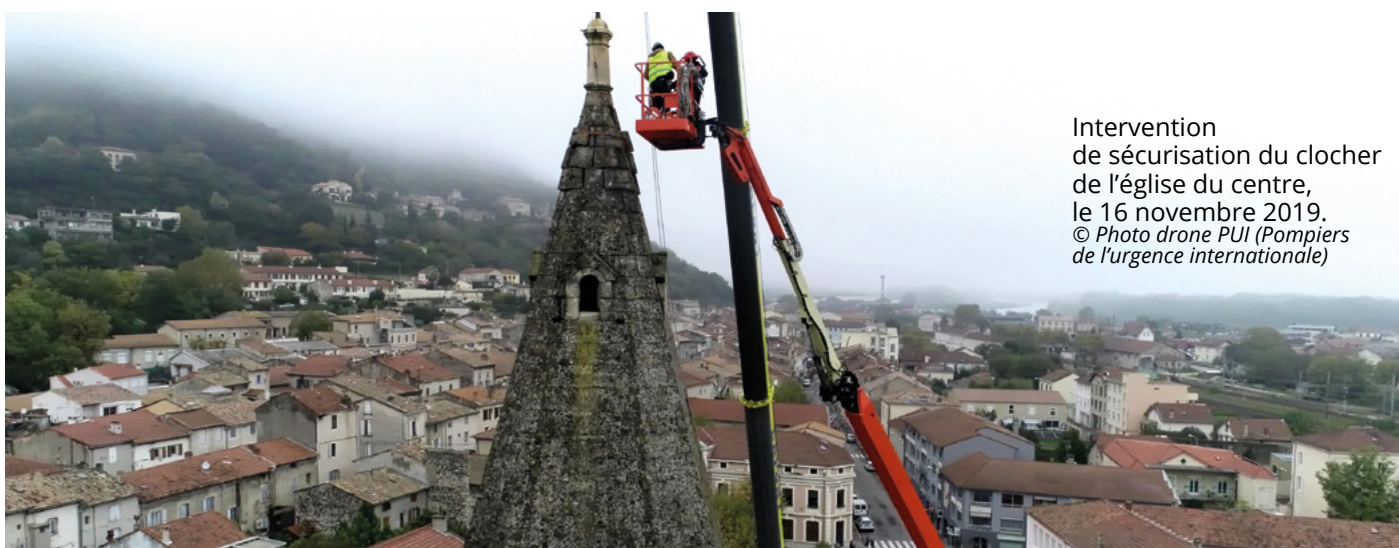
Intervention de sécurisation du clocher de l'église du centre, le 16 novembre 2019.

Église de Saint-Étienne de Mélas (église romane IXe - XIIe siècles) classée monument historique en 1875, propriété de la commune. Travaux d'urgence engagés et financés par la DRAC Auvergne-Rhône-Alpes, dès le 18 novembre 2019. Ces étaïements ont été mis en place pour éviter tout risque d'effondrement des bâtiments endommagés sur la voirie.