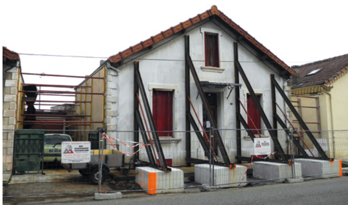
Étaïement d'une maison avenue Paul Langevin.